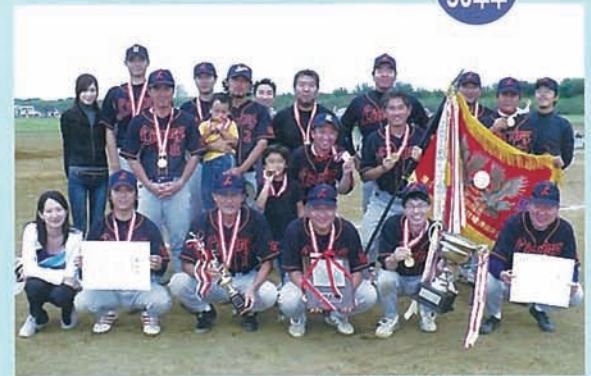
小生は前列右から2人目