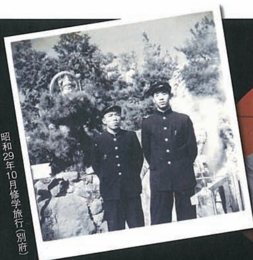
昭和29年10月修学旅行(別府)