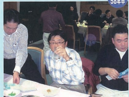
楽しい飲み会もついつい気になさるようになりました