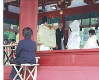
20 境内で結婚式に出会いました。 みんなの祝福をあびてお幸せに