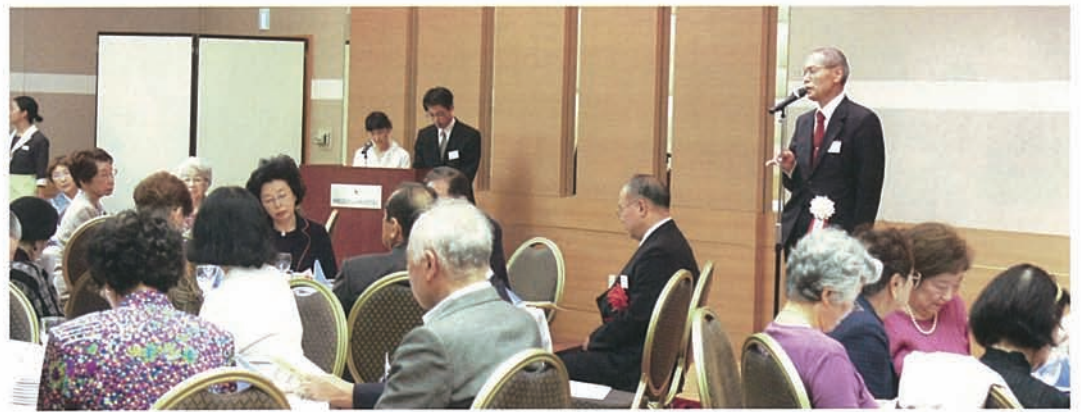
来山会長 開会のあいさつ

おかげさまで「あしび」も3号となりました。東京同窓会の会員だけでなく、福山本部の同窓会を初めとして、他支部の方にもお届け出来るよう考えております。また、本部福山では今年7月より全ての同窓生に向け、どこからでも情報が見れて、誰でも書き込みが出来るホームページを立ち上げました。離れた所にいる同期の仲間や、同窓会情報、恩師の先生の近況など、同窓会の新しい情報ツールとして大いに活用しようではありませんか。それはまさに新たな期待と更なる発見。