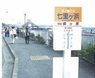
11 ず〜っと続く海岸線を見ながらマ イペースで、調子がでてきたゾ