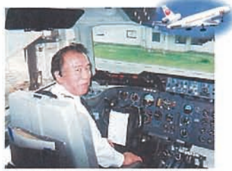
Last Flight! オレの仕事場だ

岩瀬 DC14のあと、DC16B、DC18、B172の副操縦士を経て、飛行時間約3000時間、29歳10か月で機長に昇格しました。