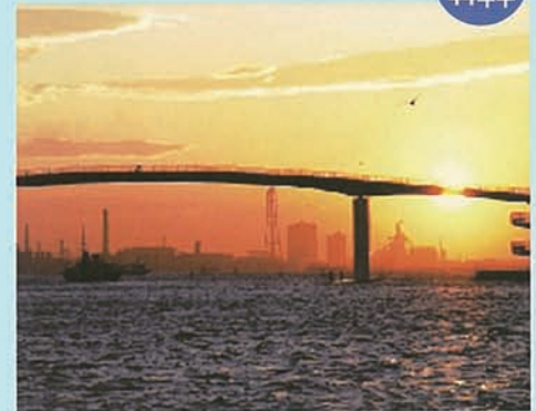
東京湾に沈む夕日