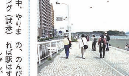
6 海岸沿いをいざ、鎌倉までただひたすらに...