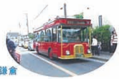
レトロなバスが鎌倉 には似合うなァ