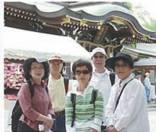
5 お参りもすんでさあ元気に無事に歩くぞ!(まだ元気な顔)