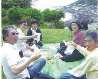
13 まるで大人の遠足みたい。やっ ぱりお弁当はおにぎりが一番