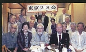
例年通り、5月、銀座に集合