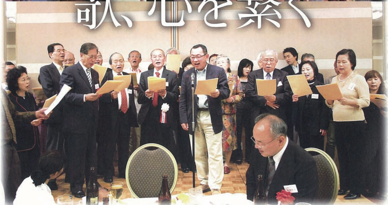
昨年の第22回東京同窓会校歌歌唱