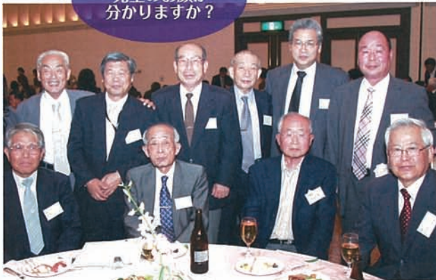
先生方ありがとうございました