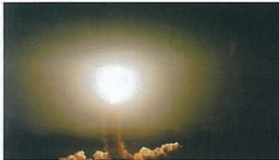
若田さん、第一回目のシャトルの打ち上げ瞬間