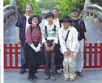
19 鳥居をくぐり目の前は鶴岡八幡 宮。ゴールは目の前だァ