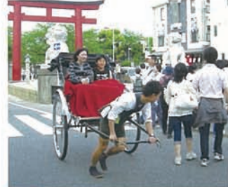
18 さすがに鎌倉の市内は古都の 雰囲気が漂います