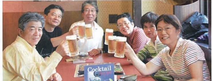
22 午後16:00 無事鶴岡八幡宮に到着。予定通り(チョット早いけど)反省会・食事会。朝はどうなることかと思いましたが、皆さんお疲れさま〜

今回は昭和40年代卒の同窓生が中心となり、年一回の同窓会以外に、老若男女、気楽に参加出来、かつ旧交を温め、軽めの運動の後には食事プラス一杯というお楽しみ(少々欲張りですが)はないだろうかと企画したものです。写真満載のウォーキング紀行となりました。楽しみが伝わるといいのですが… 今後は同窓生の参加を広く募り、年に1、2度、東京を中心とした名所旧跡を歩いて巡るものとしたいのですが、皆様いかがでしょうか? ご意見お待ちしております。