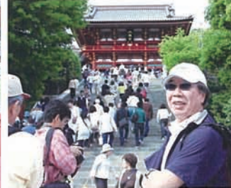
21 最後の一踏ん張り。先達、大丈 夫体調は? 誰にいつてんの…