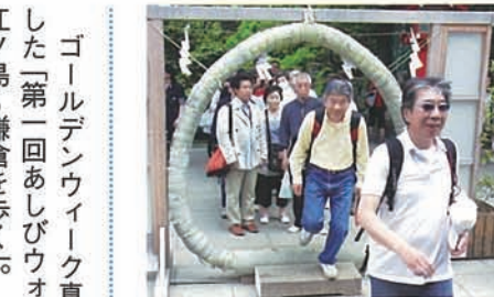
4 茅の輪くぐりにも作法があることを初めて知りました