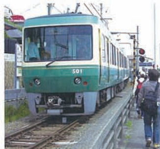
15 鎌倉までいろんな江ノ電が行き 交います。古いのや新しいのが