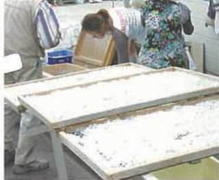
7 履越漁港名物? 生シラス。今日はお買い物ツアーじゃないよ