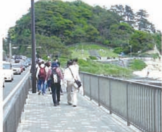
12 やっと稲村ヶ崎でお弁当です。 車はさっきから全く動かないです