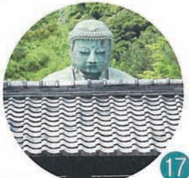
17 残念ながらあまりの人の多さに 屋根越しに参拝。次はゆっくりと