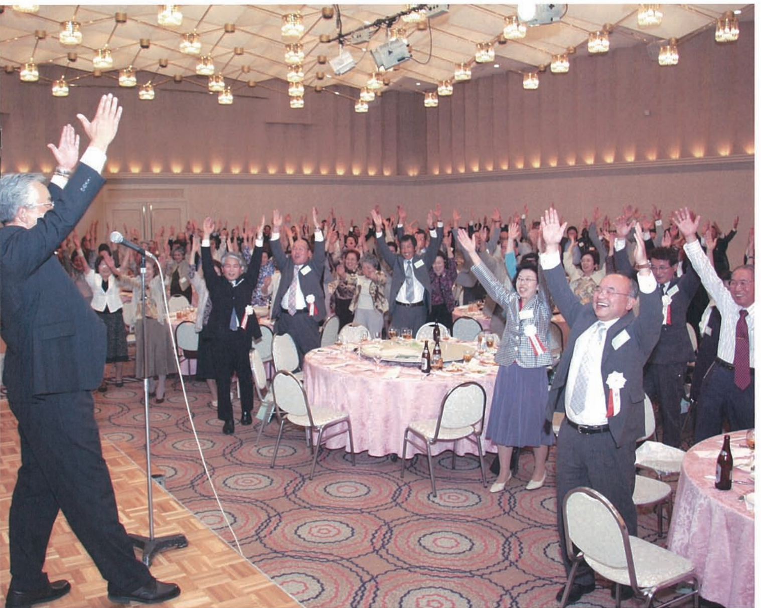
このパフォーマンスは一体何だ! 懇親会の最後に幹事47年卒、男性陣による正調「バンザイ」背筋を伸ばしてハイ! みなさんお疲れ様でした

取材・文◎45年卒 寄國 聡