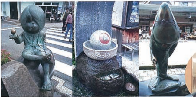
ずらり揃った水木ワールドのキャラクターたち

無事、松江に引越越し、松江地裁に勤務しています。松江の裁判所は、約150人規模の小さな裁判所です。そのため、今月始まる裁判員制度等、大きな裁判には本来の担当業務を超えて全庁全員での取り組みが必要で、そのための態勢づくりや調整に汗を流しているところです。「致団結」って流行らない時代ですので、思った以上に難しい作業です。