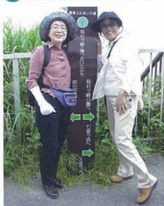
14 お腹に入ればこっちのものよ。 どこまでも歩いていけそうな顔