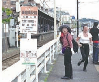
9 海と道路と江ノ電がお隣同士。毎日海を見ながら通学できたらねえ~