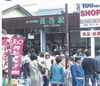
16 長谷駅も連休とあってこの通り