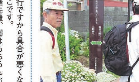
8 傍らの案内もなかなかオシャレです。目指せ稲村ヶ崎...