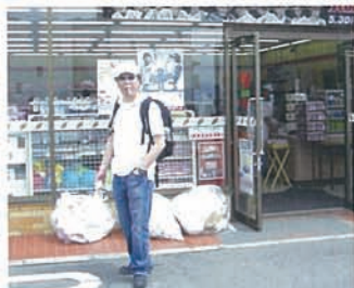
10 ちょっと一服。お昼のお弁当も買いました